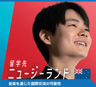
留学先 ニュージーランド 音楽を通じた国際交流の可能性