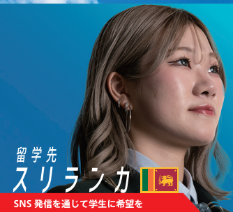
留学先 スリランカ SNS 発信を通じて学生に希望を