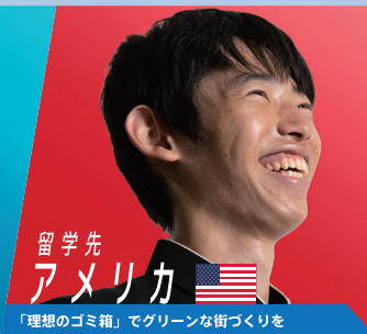
留学先 アメリカ 「理想のゴミ箱」でグリーンな街づくりを