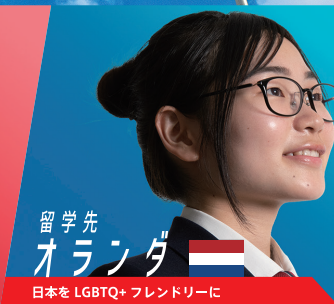
留学先 オランダ 日本を LGBTQ+ フレンドリーに